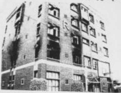
火災事故現場照片