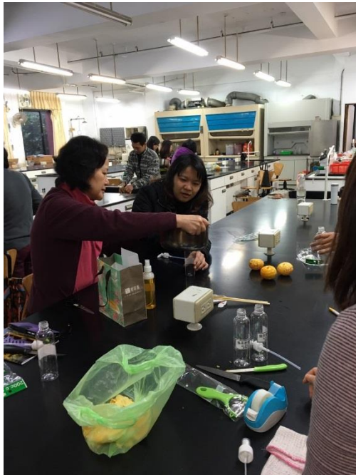
學員進行後製成品作業，小心翼翼裝瓶。