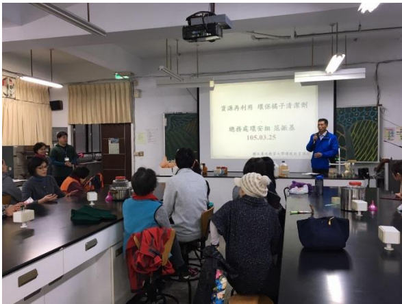
本活動由總務處主辦，開場由總務長致辭。