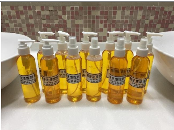
有著清潔效力的橘子皮清潔劑。