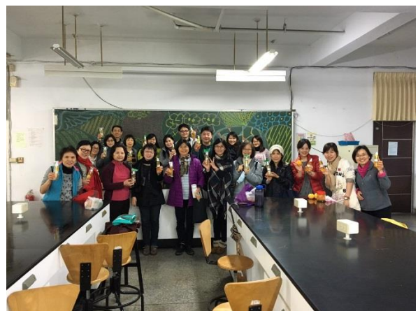
學員帶著各自的作品，最後的合影。