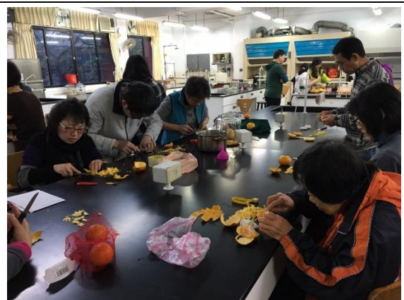
學員認真進行實作。