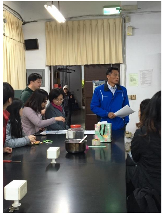
現場活動現場報名狀況，總務長準備開場。