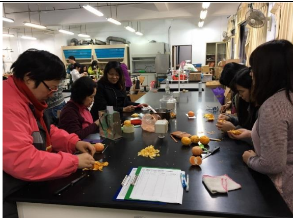
學員認真進行實作。