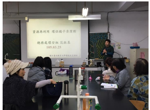
環境教育活動由環安組同仁支援講解。